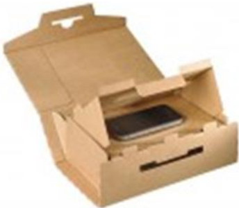
Versandkarton für elektronische Güter

Die Verpackungen werden mit Produktwerbung oder Transportinformationen bedruckt.