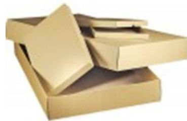
Stülp- oder Schiebe-Schachtel